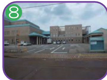
ビーチホールまがたま 3階建・海拔 7.8m