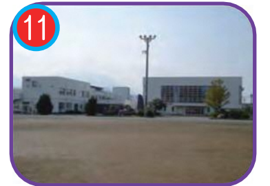
糸魚川東小学校 (指定避難所) 海拔 8.2m