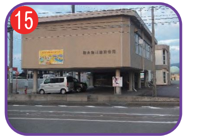
糸魚川建設会館 海拔 9.2m