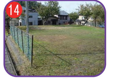
京ヶ峰区民運動広場 海拔 18.0m