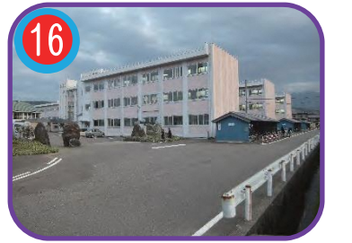
糸魚川高等学校 (指定避難所) 海拔 7.8m