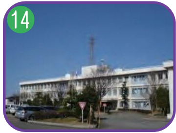
糸魚川地域振興局 3階建・海拔 10.0m